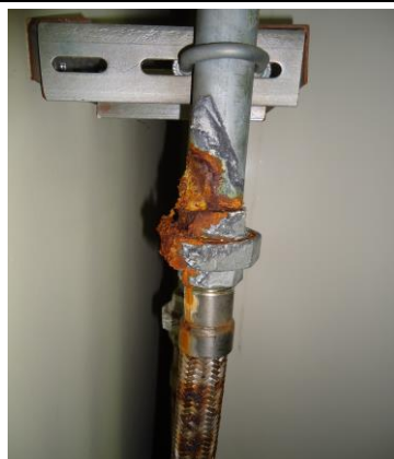
10、冷卻水管路有銹蝕的狀況