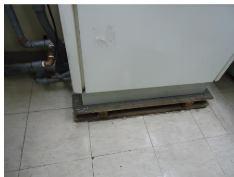
7、檢視周遭是否有漏水狀況