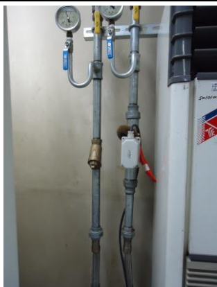
9、檢冷卻水管是否有銹蝕