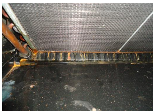
6、檢視排水盤是否有積水阻寒